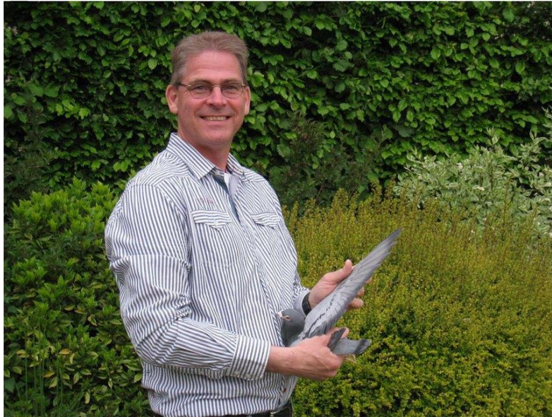
Combinatie de Dooij, winnaar Gemeentebeker 2020

Ook dit jaar is er een klassement opgemaakt voor de gemeentebeker. Door de Corona-pandemie is het wel nog de vraag of en wanneer deze prijs uitgereikt kan worden. De competitie is als volgt: Van de 7 disciplines telt telkens de 2 e vlucht en op basis van de normale berekening van de kampioenschappen. Dit wil zeggen de eerste duif telt, maar ook de eerste of 2 e getekende zorgen voor punten. Dit jaar is de winnaar de Combinatie de Dooij .