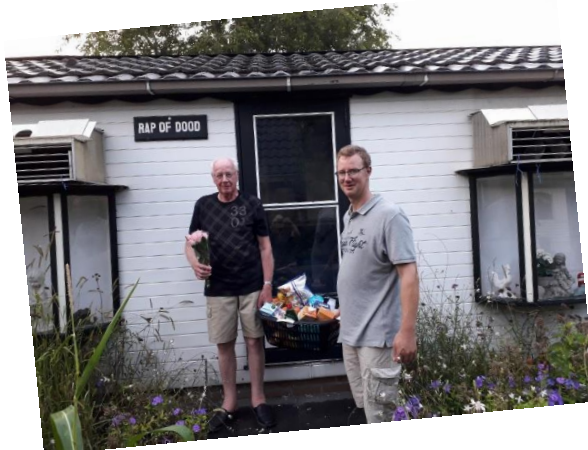
Schoonen-Doeland (1907 + 1926)

De Paas- of voorjaarsvlucht met de bijbehorende prijzen kon uiteraard ook niet doorgaan, maar deze werd verplaatst naar Niergnies op 1 augustus. Hieronder de winnaars van deze vlucht.